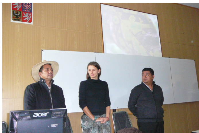
Beseda s pěstiteli kávy.

V první polovině listopadu měli studenti další možnost seznámit se s problematikou fair trade prostřednictvím výukových programů s názvy „Šaty dělají člověka“ a „Hořká chuť čokolády“.